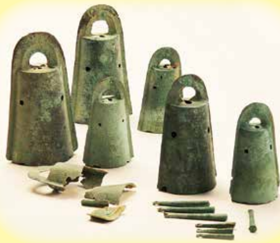
松帆銅鐸