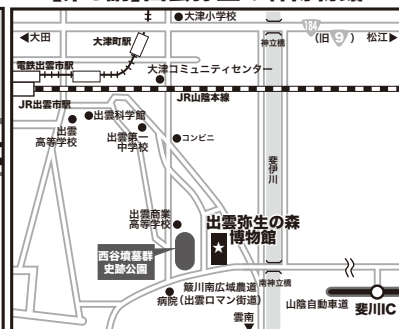
【第3講】出雲弥生の森博物館