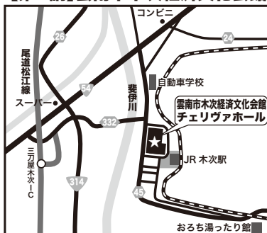
【第1講】雲南市木次経済文化会館