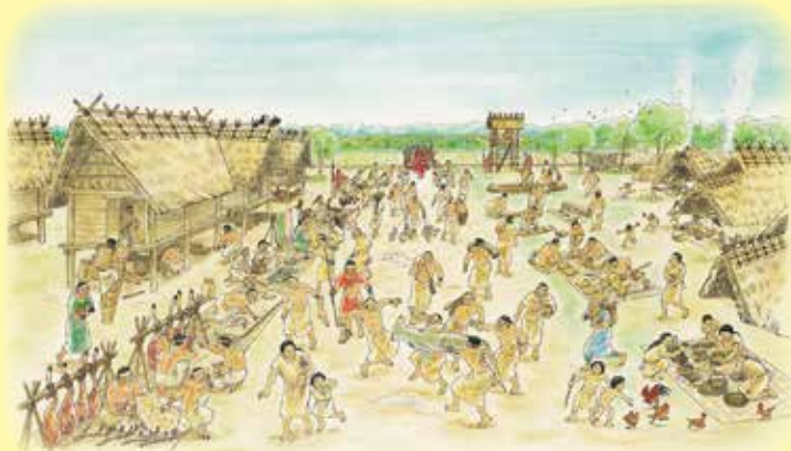
出雲の弥生ムラ (早川和子 作画)