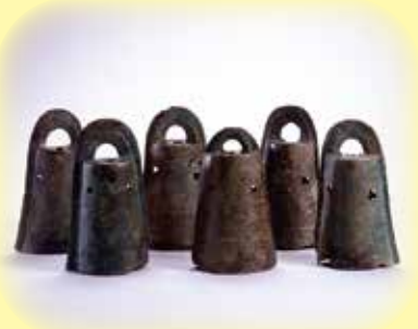
国宝 荒神谷遺跡出土銅鐸