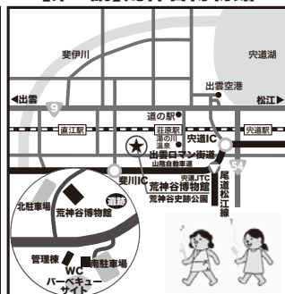
【第2講】荒神谷博物館