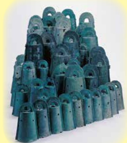
国宝 加茂岩倉遺跡出土銅鐸